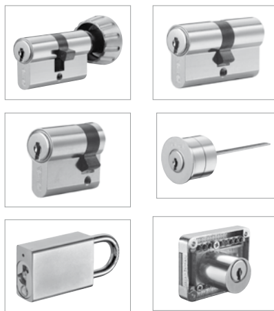
Systém Kaba maTrix lze použít v různých vložkách zámčích.

Systém Kaba maTrix je vhodný pro všechny typy vložek (oboustranná vložka, knoflíková vložka, spínačová vložka, vložka visacího zámku apod.) Pro individuální požadavky zákazníka mohou být vyrobena i zvláštní provedení vložek.