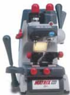
Stroj Silca Matrix SLX

Klíče systému Kaba maTrix mohou být vyráběny pomocí Silca mechanických strojů Matrix a nebo elektronických strojů Triax a Quatrocode. Mateční klíče pro stroje Matrix jsou vyráběny Kabou exkluzivně pro její smluvní partnery. Klíče Kaba maTrix mohou být dodávány jako "SmartKey" s dvanácti rozlišovacími klipy, s prodlouženou hlavou bez klipu nebo s klipem "LargeKey" pro jednodušší ovládání vložek v rozetách a ve vícerozvorových zámčích.