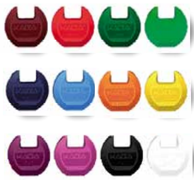
12 různobarevných klipů zaručí přehlednost

Obchodnický kód klíče Kaba maTrix je vytvářen počítačově řízeným frézováním s nejvyšší přesností. Klíče se vyznačují vysokým stupněm bezpečnosti, zanedbatelným opotřebením a absolutní