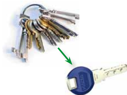
V rámci systému Kaba maTrix je "svazek klíčů" výrazně lehčí.

Co je na tom zvláštní: můžete objednat Vaše uzamykací vložky tak, že je budete moci všechny ovládat jediným klíčem (sjednocené uzamykací vložky).