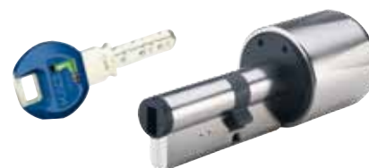
Vložky Kaba maTrix lze také integrovat do mechatronických systémů

Vložky Kaba maTrix jsou kdykoliv v budoucnu vhodné k dovybavení mechatronickým systémem Kaba eLogic. Osazením hlavy klíče klipem s Legic® čipem získáváme médium, které ovládá nejen mechanickou vložku, ale stává se zároveň elektronickým průkazem, který ovládá elektronicky řízené prvky přístupové kontroly, slouží ke sběru dat a pro bezhotovostní platební provoz.