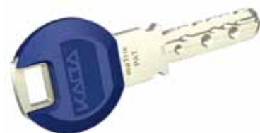
Klíč Kaba maTrix „SmartKey“