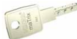
Prodloužená hlava klíče, možnost zákaznické ražby

Kaba nepřijímá žádnou záruku za provedení klíče. Za dodržení kvalitativních kritérií firmy Kaba odpovídá výrobce klíčů. Kaba však poskytuje k dispozici všeobecná doporučení pro patřičné použití strojů Silca Matrix.