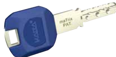
Prodloužený klíč Kaba maTrix „LargeKey“ je nejvhodnější pro rozety a vícerozvorové zámky